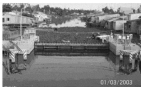
Cống đập Phước Long (Bạc Liêu) lúc mở (trái) và đóng cửa cống (phải)

Trong vùng ngọt hóa, có một phần diện tích đáng kể thuộc các huyện Phước Long, Hồng Dân và Giá Rai trước đây nuôi thủy sản, nay có nước ngọt nhưng trồng lúa không hiệu quả. Do công trình không hoàn thiện, nước mặn vẫn xâm nhập được vào vùng ngọt hóa tạo điều kiện nuôi tôm trên các diện tích trũng thấp, nhất là những khu vực trồng lúa kém hiệu quả. Ngoài ra, từ năm 1999 giá tôm sú tăng mạnh, nuôi tôm có lợi nhuận cao hơn so với trồng lúa, nên ở vùng Nam dân phá đê phá đập đưa nước mặn vào đồng ruộng để chuyển sang nuôi tôm. Phong trào nuôi tôm bộc phát, kích thích người dân vùng phía Bắc trước đây đã nuôi tôm trong vùng trũng càng quyết tâm nuôi tôm trở lại trong vùng ngọt hóa. Một số đê đập bị dân phá hủy thêm. Sau này, việc nuôi tôm thất bại, phá sản, vì bệnh, giá tôm trên thị trường quốc tế thấp, tôm xuất cảng bị trả lại vì không theo đúng tiêu chuẩn y tế, v.v. một số nông dân trong vùng ngọt hóa chuyển sang nuôi tôm nay trở lại trồng lúa thì đất đã bị sa mạc hóa vì nhiễm mặn trở lại.