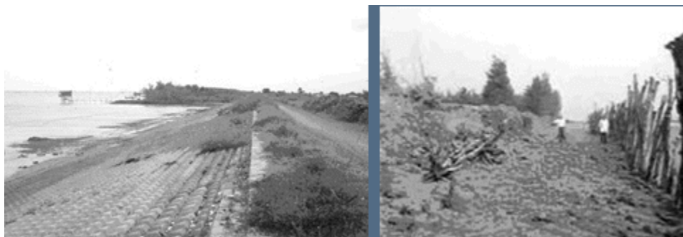
Đê biển Gò Công (trái) và đê biển Hiệp Thạnh Trà Vinh (phải)

Trên địa phận Trà Vinh, có tuyến đê biển Hiệp Thạnh, dài 1.5 km, chạy dài từ vàm Khâu Râu tới vàm Láng Nước được xây dựng năm 1997 để ngăn nước biển tràn vào đất liền, bảo vệ khoảng 200 ha đất sản xuất nông nghiệp và nuôi trồng thủy sản. Nay bị sạt lở.