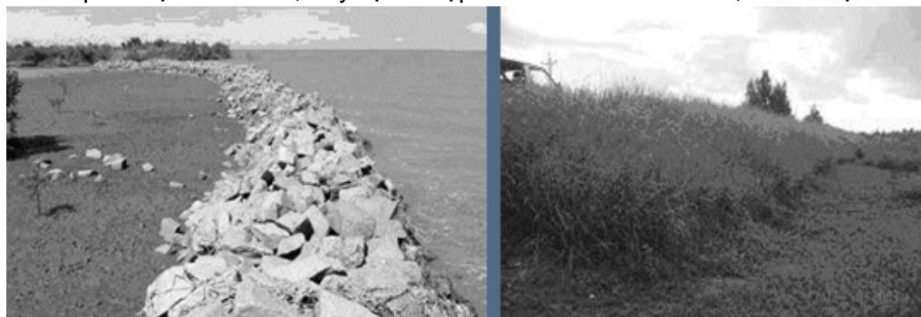
Đê biển Bạc Liêu bằng đá (trái) hay bằng đất bảo vệ với thảm cỏ Vetiver, đê cũng là lộ giao thông (phải)

Cà Mau có hệ thống đê biển dọc Biển Đông và Biển Tây. Phía Biển Đông có đê biển dài 150 km, từ Đất Mũi đến Cửa Gành Hào. Phía Biển Tây có đê biển dài 260 km chạy dọc theo bờ Biển Tây từ Đất Mũi tới Rạch Giá, xây năm 1997. Tuyến đê biển này vừa ngăn mặn, giữ nước ngọt, vừa là tuyến giao thông huyết mạch nối liền các cụm dân cư ven biển. Tuyến đê này khi mới đắp có độ cao 2.5 m, nay bị lún sập chỉ còn 1.7m – 2.0 m , và hư hại nhiều đoạn.