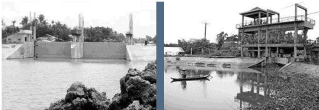
Cống Búng Lớn trong công trình Ô Môn – Xà No

Công trình từng bị dư luận chỉ trích là áp đặt cách qui hoạch thủy lợi của vùng đồng bằng sông Hồng vào ĐBSCL, làm hạn chế giao thông đường thủy, ảnh hưởng môi trường tự nhiên, vẫn gây thiếu nước phục vụ sản xuất nông nghiệp, v.v. Dự trù xong năm 2006, nhưng đến nay chưa hoàn thành.