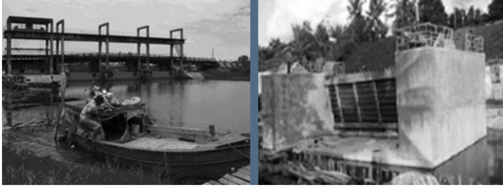
Cổng đập Tuần Thống ở biển Tây cuối kinh T5 (phải), và kiểu đập Sà lan ở Cà Mau

Tóm lại, hệ thống đê biển rời rạc, yếu, thấp và xuống cấp. Nhiều đoạn đê đã xói lở, dân chúng xây cất bừa bãi trên đê, đào phá ăn cắp đất, rừng phòng hộ bên ngoài bị phá hủy, nhiều nơi không có rừng bảo vệ. Các cổng đập cũng không làm tròn sứ mạng ngăn mặn.