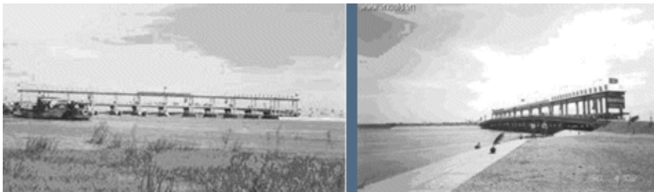
Đập Ba Lai (Bến Tre)

Đập Ba Lai dài 544 m, đỉnh đập cao 3.5 m, đáy sông sâu 8.0 m, mặt đập rộng 10 m. Cống Ba Lai gồm 10 cửa, mỗi cửa kích thước 8 m x 7.2 m, chiều rộng thông nước (khẩu độ) 84 m, chiều dài thân cống 16 m, vận hành bằng van tự động 2 chiều.