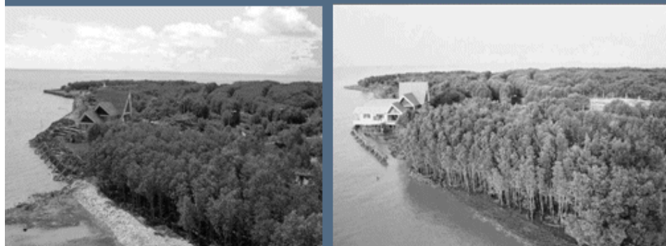
Đê biển tại Mũi Cà Mau khi thủy triều xuống (trái), và khi thủy triều lớn (phải)

Ở Kiên Giang, từ Rạch Giá đến Hà Tiên có đê biển dài 74 km, với 23 cống ngăn mặn để bảo vệ khu Tứ Giác Long Xuyên. Cống Tuần Thống có nhiệm vụ ngăn mặn xâm nhập vào Tứ Giác Long Xuyên.