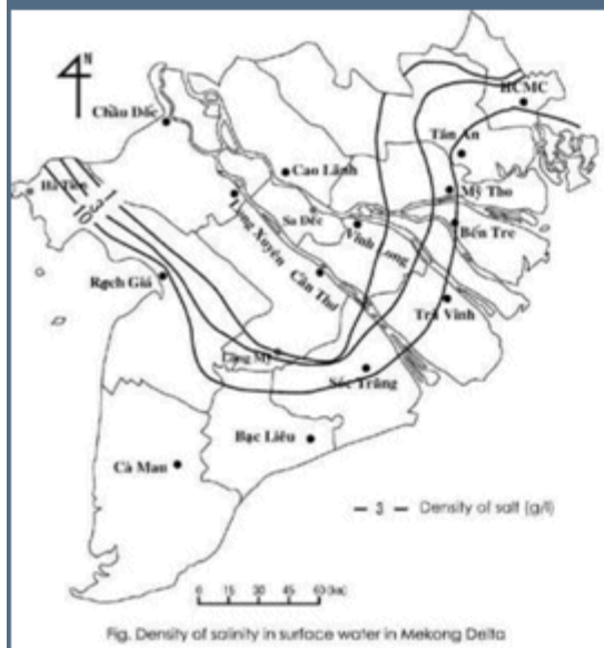
Ranh nước biển xâm nhập vào nội địa ĐBCLVN với nồng độ muối 10 g/l, 3 g/l và 1 g/l (7).

Việt Nam chưa có nghiên cứu về lưỡi mặn trên các sông. Các ngư dân vùng Cần Thơ thỉnh thoảng bắt được cá biển, chứng tỏ mặc dầu nước mặn 1 g/l ở trên mặt sông vùng Trà Ôn nhưng lưỡi mặn ở đây có thể đến Cần Thơ.